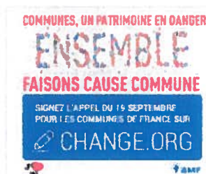
Mobilisation des maires de France

La mairie de Nézel a participé le 19 septembre à la mobilisation des Maires dans le cadre de la pétition en ligne de l'Association des Maires de France (AMF) contre la baisse des dotations de l'Etat. L'objectif de cette pétition est de mobiliser les élus et les citoyens sur la défense de la commune et contre la baisse programmée de 30 % des dotations de l'Etat. La pétition, accessible sur le site internet de l'AMF et sur le