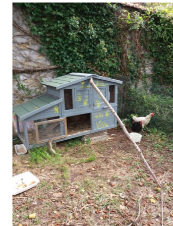
Ha les belles poulettes !

Notre programme Eco-gestion s'exerce principalement au niveau des espaces verts de la commune.